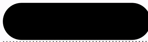
Mgr. Zdeňka Hamousová starostka města Žatec